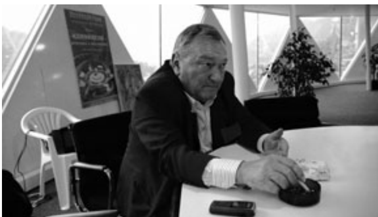
Erich von Däniken fotograferet i 2005 på sin 70 års fødselsdag i kontoret i Mystery Park, Interlaken, Schweiz. Däniken er stadig aktiv og rejser det meste af året.

udbredelse. Der var tydeligvis grobund for provokerende påstande, der talte autoriteterne midt imod. Dänikens oprør mod gængse arkæologiske antagelser vandt gehør i et vestligt samfund præget af modstand mod intellektuelle autoriteter (ungdomsoprøret), lede ved militære autoriteter (bl.a. som følge af Vietnamkrigen), og frygt for hvad videnskaben kunne påføre os (atomvåbenfrygten under Den kolde Krig) osv.