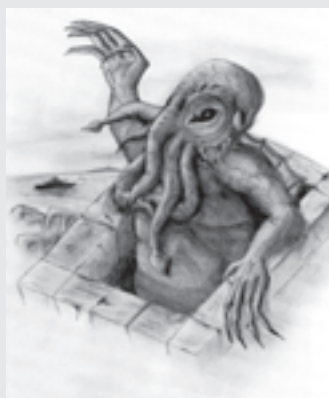
Den ikke-jordiske gud, Cthulhu, stiger op fra sin krypt i det sunkne kontinent R'lyeh i Lovecrafts historie "The Call of Cthulhu" fra 1926.

et blæksprutteagtigt hoved og en grotesk skikkelse. Derefter følger en efterforskning, der afdækker noget af gåden om R'lyeh og Cthulhu. Under denne efterforskning hører man historien om nordmanden Gustav Johansen, som var eneste overlevende efter et besøg til R'lyeh.